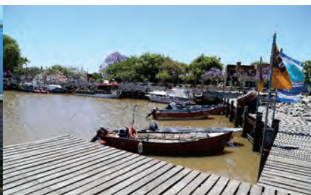
Puerto de Nueva Palmira