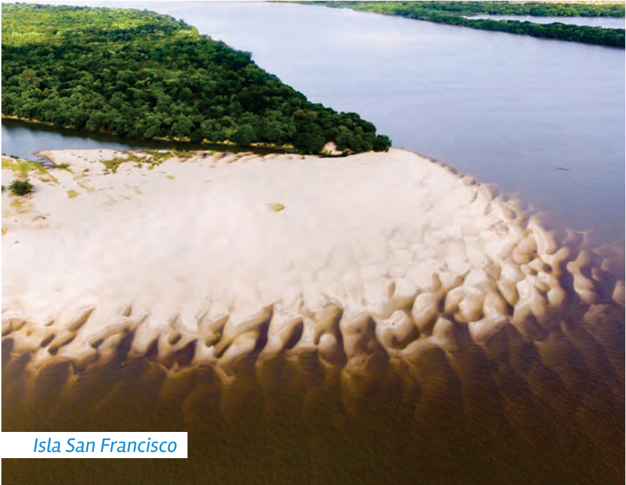
Isla San Francisco

La isla Pepeají tiene en su extremo Norte una gran punta de arena que hace que el canal sea muy angosto. Sobre la costa uruguaya hay piedras.