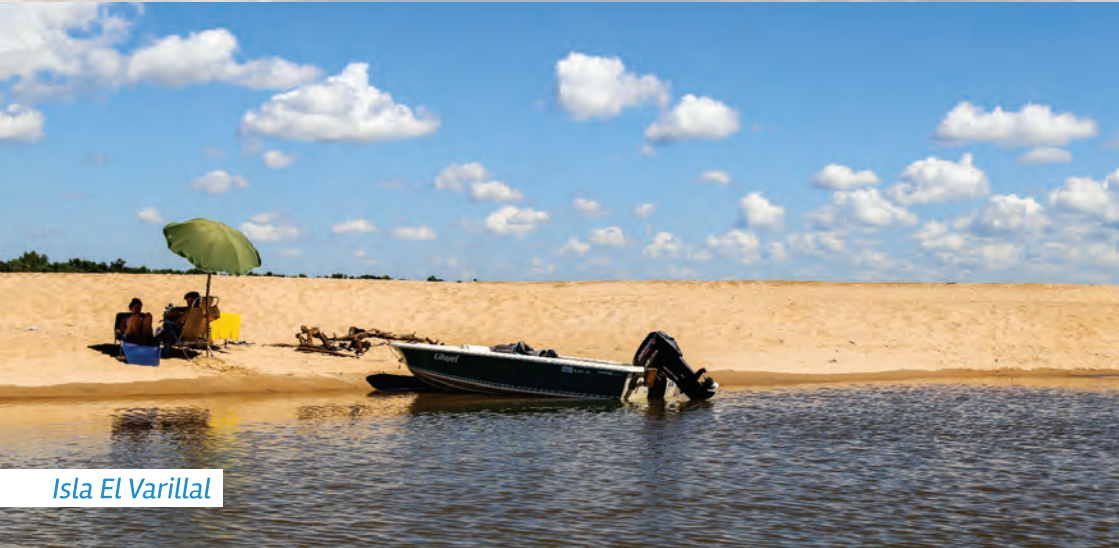
Isla El Varillal